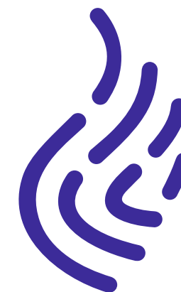
Одноцветная версия в синем цвете. Используется для печати на ч/б принтере, гравировке на сувенирной продукции