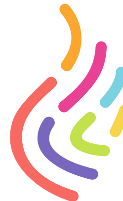
Полноцветная версия . Основная версия эмблемы. Используется для полноцветной печати

Одноцветная версия используется в тех случаях, когда полноцветная печать невозможна.